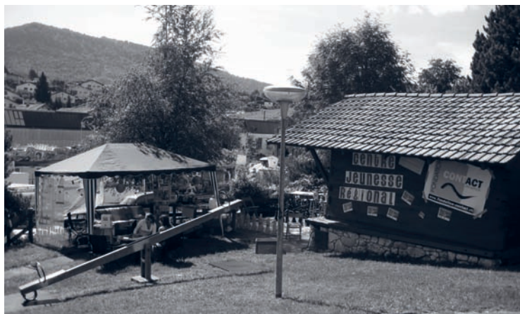
Stand à la foire de Chaindon

Une information a été donnée à l'équipe éducative de La Grande Maison à Corgémont, avec comme thématique la consommation de cannabis et l'attitude à avoir face aux jeunes qui consomment. D'autre part, plusieurs étudiants qui entreprenaient un travail sur les addictions ont été reçus dans le courant de l'année 2010.