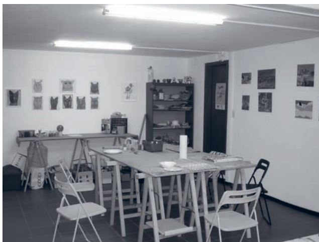
Atelier Imag'In de Saint-Imier

Peinture, bricolages, bijoux, collage, écriture, dessins, rénovation de meubles, poterie, ainsi que toute autre idée amenée par les participants sont pratiqués dans les ateliers. Les bénéfices récoltés sont nombreux. Les ateliers permettent notamment de sortir de chez soi et de retrouver une vie sociale, de se changer les idées, de partager ses soucis, ses rires et ses expériences personnelles, de retrouver un rythme dans la semaine, d'apprendre des techniques de création et de passer un moment convivial et chaleureux. Les participants quant à eux décrivent et associent les ateliers avec les termes suivants : convivialité, liberté, création, partage, rencontre instructive, enrichissant, épanouissant, gratifiant, se découvrir soi-même et les autres, dynamique, amical, intergénérationnel, solidarité.