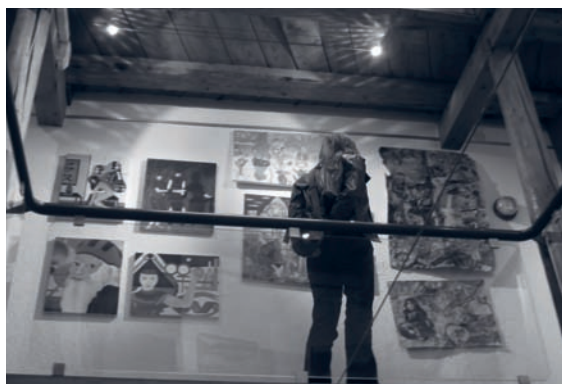
Exposition des ateliers Imag'In

Pour fêter cet anniversaire, le personnel a organisé quelques manifestations dans le courant de l'année 2010 : une exposition des ateliers Imag'In a eu lieu à la Galerie Espace Noir à Saint-Imier durant les mois d'avril et de mai. Une douzaine de participants ont exposé une centaine d'œuvres, ce qui a permis à leurs proches et à la population d'apprécier les travaux réalisés.