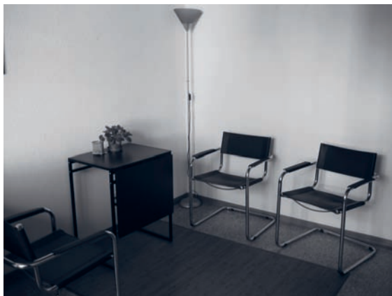
Un endroit pour un entretien

L'offre de consultations psychosociales est adaptée à la demande et aux besoins des clients, qui peuvent être très variés et concerner autant la consommation de drogues que d'autres aspects de leur situation personnelle. Ces prestations concernent aussi la famille et l'entourage, à qui un espace de parole et de soutien est proposé. Les consultations psychosociales sont confidentielles et gratuites.