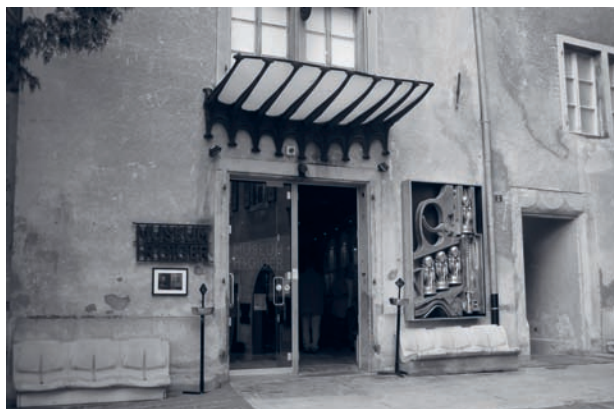
Visite au musée Giger

La fréquentation de l'espace d'accueil est en constante augmentation ces dernières années. Durant l'année 2010, il y a eu 1 468 passages, contre 1 036 pour l'année 2009. 54 personnes ont fréquenté plus ou moins régulièrement l'espace d'accueil, contre 39 pour l'année 2009. 625 repas ont été servis durant l'année 2010, y compris les portions à l'emporter, contre 387 pour l'année 2009.