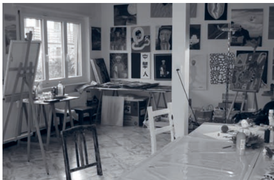
Atelier Imag'In de Moutier

Autre prestation à bas seuil, les ateliers d'expression et de création «Imag'In» sont proposés à Moutier les jeudis après-midi et à Saint-Imier les mardis après-midi. La participation est ouverte à tous et gratuite, sans nécessité d'inscription préalable.